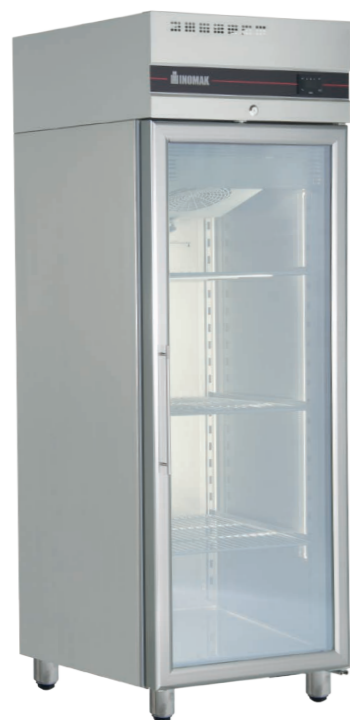
Series C/GL700 C/GLN700