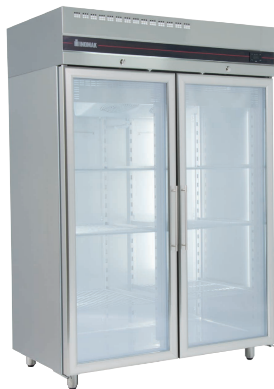
Series C/GL700 C/GLN700