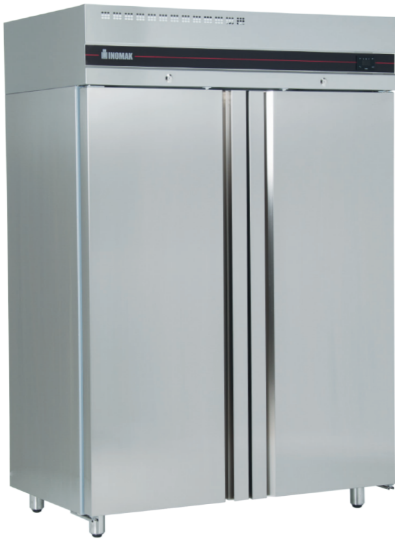
Series C1400 - C/N1400 C/SL1400 - C/SLN1400 - C/M1400