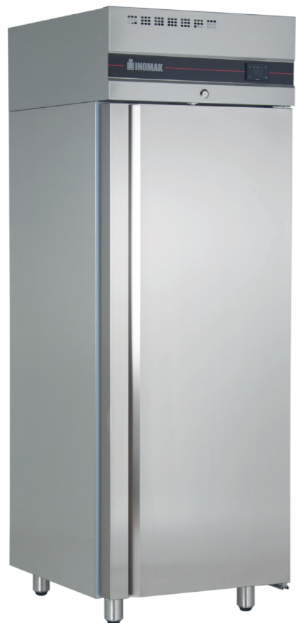
Series C700 - C/N700 C/SL700 - C/SLN700 - C/M700